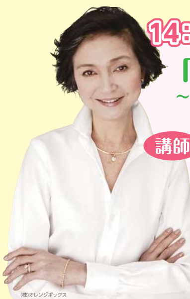
(株)オレンジボックス