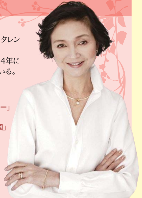
(株)オレンジボックス